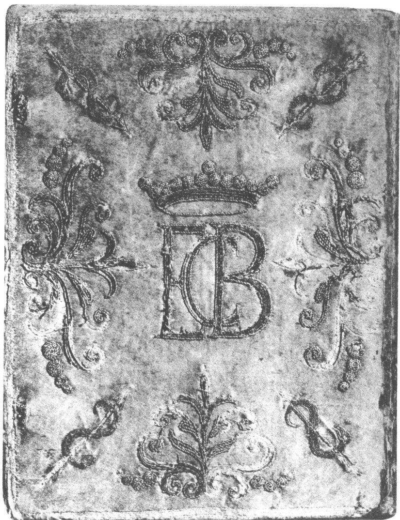
Couverture de satin bleu pâle, brodé de fil d'argent.