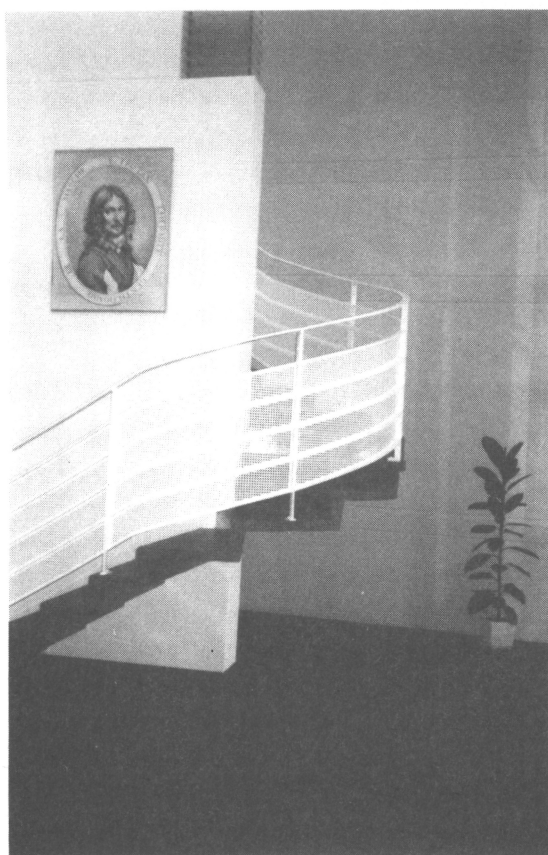
Ecole Tristan-L'Hermites La Souterraine (Creuse) Architectes :