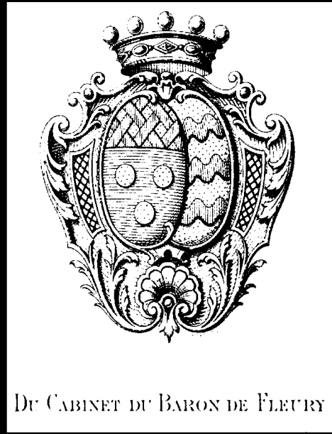
DU CABINET DU BARON DE FLEURY