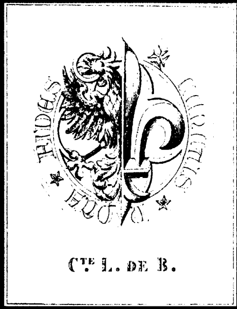
C TE L. DE B.